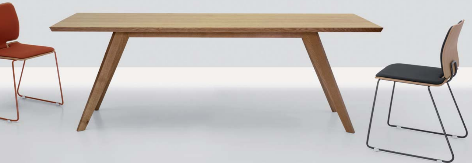
CENA, Eiche mit Stuhl FORM

Der Tisch CENA orientiert sich am historischen Vorbild der Tafel und interpretiert das vertraute Motiv in zeitgemäß minimierter Form. Er zeichnet sich durch einen starken, selbstbewussten Charakter aus. Sein Wert ist bestimmt durch den Kontrast von optischer Leichtigkeit und hoher Standfestigkeit. Durch die rückspringenden Beine können sowohl Stühle als auch Bänke frei um den Tisch gruppiert werden.