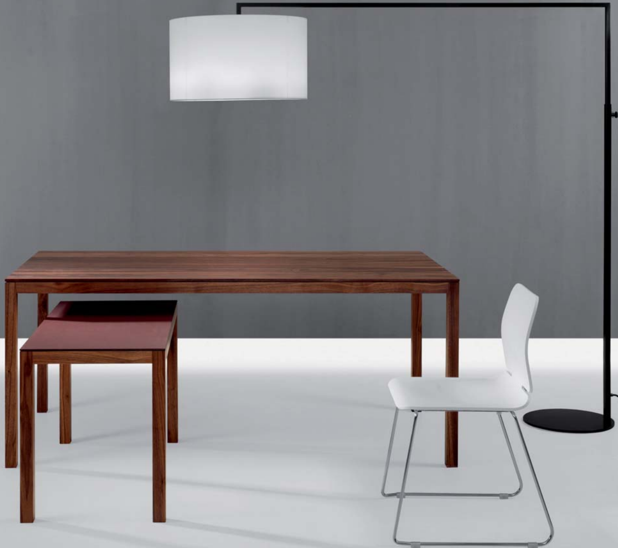
DOMINO, amerikanischer Nußbaum mit Stuhl FORM und Leuchte HIGH NOON

Das Tischprogramm DOMINO basiert auf dem Gedanken der vielseitigen Nutzung. Die klare und sachliche Gestaltung ermöglicht einen flexiblen Einsatz sowohl im Wohn- als auch im Arbeitsbereich. Der große Tisch kann durch die kleineren Konsoltische seitlich verlängert werden. Werden diese am Tisch nicht gebraucht, sind sie als eigenständige Solitärmöbel vielseitig verwendbar, z.B. als Wandkonsoltisch oder als Sekretär.