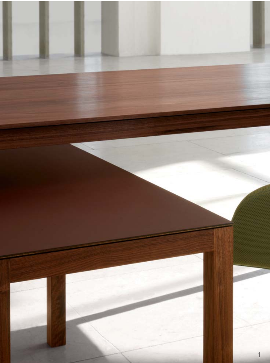
Table and console table, solid wood, Beech, maple, oak, American cherry, American walnut, European walnut h 75cm, table-top-thickness 25mm, visible 6mm Available in further sizes and timbers The wood is impregnated with pure natural waxes.

Tisch und Konsoltisch, Massivholz Buche, Eiche, Ahorn, amerikanische Kirsche, amerikanischer Nussbaum, europäischer Nussbaum h 75cm, Plattenstärke 25mm, sichtbar 6mm Ausführung in weiteren Holzarten und Maßen erhältlich Das Holz ist mit hochwertigen, natürlichen Ölen und Wachsen behandelt.