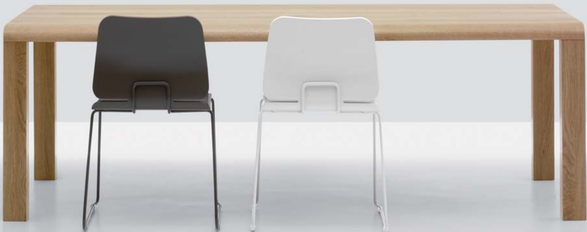
FLOW, Eiche mit Stuhl FORM

Tisch und Bank zum Erfühlen. Das charaktervolle Erscheinungsbild zeigt die weich formbare Qualität von massivem Holz. Die fließende Form ist angenehm zu begreifen und sorgt zudem beim Sitzen für Komfort. Die Platte ist handwerklich mit innen- liegenden Rohren als Gratleisten gearbeitet. Diese Konstruktion erlaubt dem Massivholz die nötige Bewegung.