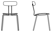
Holzstuhl // Wooden seat

Beech black, oak, oak stained black, American walnut Colour stain on request Frame: metal matt black powder coated (RAL 9005) h 79 cm, w 47 cm, d 48 cm, seating h 46 cm CATAS Test EN 1728:2012 Level 2 – extreme